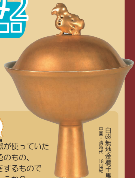
白磁無地金襴手馬上盃「金珠瓊」 中国・清時代 18世紀 高21cm