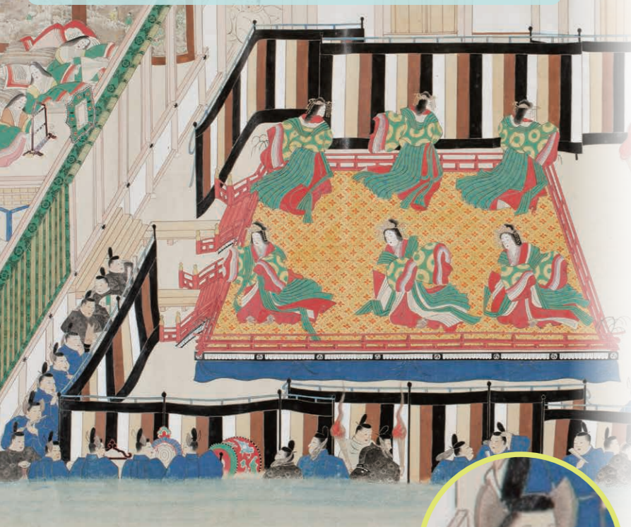
年中行事絵巻(部分) 原在明筆 江戸時代