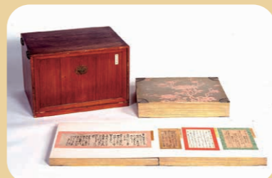
【国宝】大手鑑 近衛家熙編集 奈良~室町時代 下帖のみ後期展示