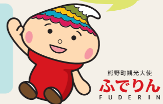
熊野町観光大使 ふでりん FUDERIN