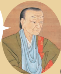
近衛家熙像(部分) 九録自端贊 寛深画 江戸時代